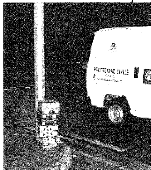
CENTINAIA I BOTTI INESPLISI DISSEMINATI PER LE VIE CITTADINE

ne che hanno aiutato l'Amministrazione Comune di San Nicola la Strada a diffondere questo progetto anche nei comuni limitrofi, nell'interesse di tutti i cittadini per trascorrere un capodanno sereno ma soprattutto privo di incidenti.